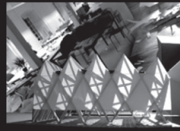
21 mars 11h