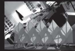
21 mars 13h