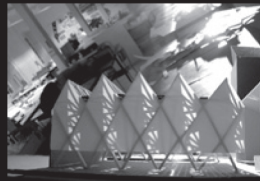
21 mars 10h