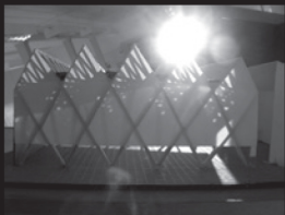
21 dec. 10h