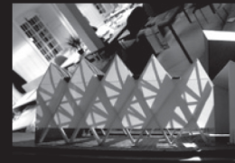
21 mars 12h